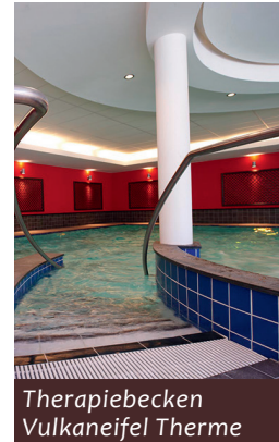
Therapiebecken Vulkaneifel Therme