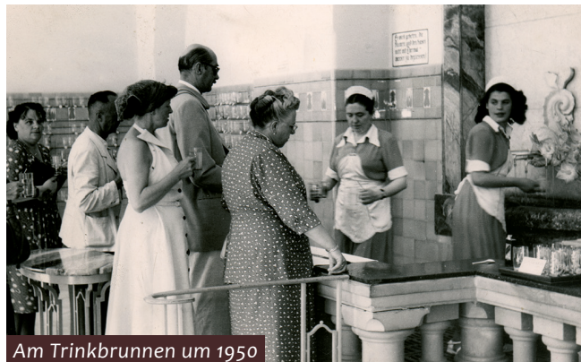
Am Trinkbrunnen um 1950

Die Römische Bäderkunde bildet noch heute die Grundlage für viele Heil- und Thermalbäder. Im Laufe der Jahrhunderte festigte und erweiterte sich das Wissen über die heilsame Wirkung der Bad Bertricher Bergquelle, die auch heute noch medizinisch genutzt wird. Sowohl zur Vorsorge als auch bei der Behandlung verschiedener Beschwerden ist das Bad Bertricher Thermalmineralwasser sehr wirksam.